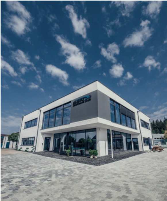
Firmengebäude in Stöttlen.