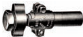
Original "Boss" Kupplung, patentiert 1917