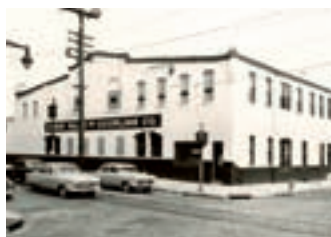
Lager und Versandabteilung in Columbia, Philadelphia

Aufgrund seiner anhaltenden Begeisterung und den ständigen Innovationen im Bereich der Schlaucharmaturen gründete er die Dixon Valve and Coupling Company. Das Unternehmen fertigte im wesentlichen Armaturen für den Bergbau, die Öl- und Maschinenbauindustrie.