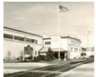
Chestertown, Maryland Produktionsgebäude

1976 verlagerte die Dixon Gruppe ihren Hauptsitz und den größten Teil der amerikanischen Produktionsstätten an den heutigen Standort Chestertown im Bundesstaat Maryland.