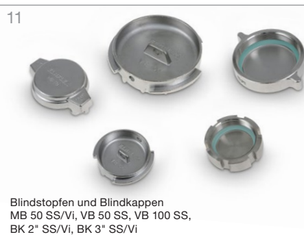
11 Blindstopfen und Blindkappen MB 50 SS/Vi, VB 50 SS, VB 100 SS, BK 2" SS/Vi, BK 3" SS/Vi