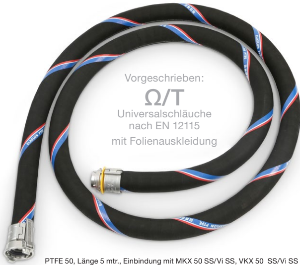
PTFE 50, Länge 5 mtr., Einbindung mit MKX 50 SS/Vi SS, VKX 50 SS/Vi SS – alternativ: UTS 50 oder Polypal Plus 50 –

Basis der Ausrüstung sind 10 Schlauchleitungen DN 50 \Omega /T-Leitfähigkeit nach EN 12115 – wahlweise Type UTS bzw. Polypal Plus (UPE-Innenschicht) oder Elaflon PTFE (PTFE-Innenschicht). Schlaucharmaturen nach DIN EN 14420-6 mit TW-Vater- und Mutterkupplung aus Edelstahl (Blindkappen und -stopfen siehe Bild 11). Einbindung mit Spannfix- oder Spannloc Sicherheitsklemmschalen aus Edelstahl.