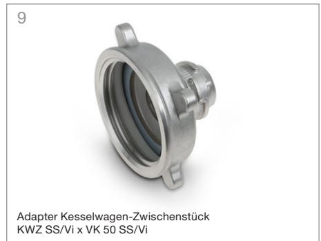
9 Adapter Kesselwagen-Zwischenstück KWZ SS/Vi x VK 50 SS/Vi