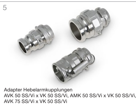
5 Adapter Hebelarmkupplungen AVK 50 SS/Vi x VK 50 SS/Vi, AMK 50 SS/Vi x VK 50 SS/Vi, AVK 75 SS/Vi x VK 50 SS/Vi