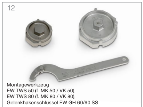
12 Montagewerkzeug EW TWS 50 (f. MK 50 / VK 50), EW TWS 80 (f. MK 80 / VK 80), Gelenkhakenschlüssel EW GH 60/90 SS