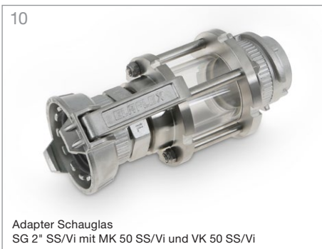
10 Adapter Schauglas SG 2" SS/Vi mit MK 50 SS/Vi und VK 50 SS/Vi