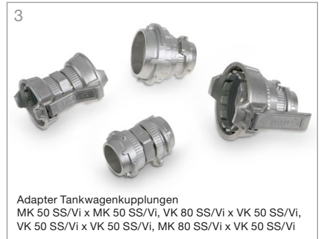
3 Adapter Tankwagenkupplungen MK 50 SS/Vi x MK 50 SS/Vi, VK 80 SS/Vi x VK 50 SS/Vi, VK 50 SS/Vi x VK 50 SS/Vi, MK 80 SS/Vi x VK 50 SS/Vi