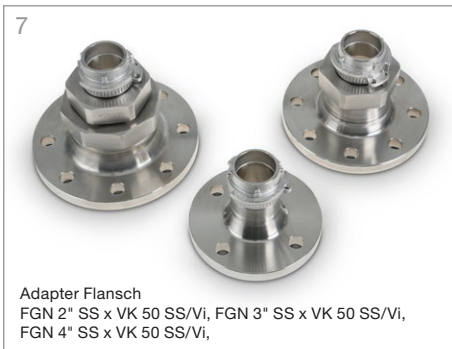
7 Adapter Flansch FGN 2" SS x VK 50 SS/Vi, FGN 3" SS x VK 50 SS/Vi, FGN 4" SS x VK 50 SS/Vi,