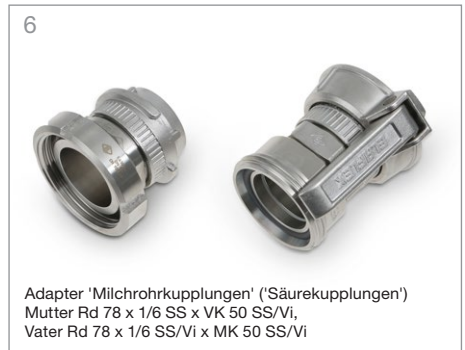
6 Adapter 'Milchrohrkupplungen' ('Säurekupplungen') Mutter Rd 78 x 1/6 SS x VK 50 SS/Vi, Vater Rd 78 x 1/6 SS/Vi x MK 50 SS/Vi