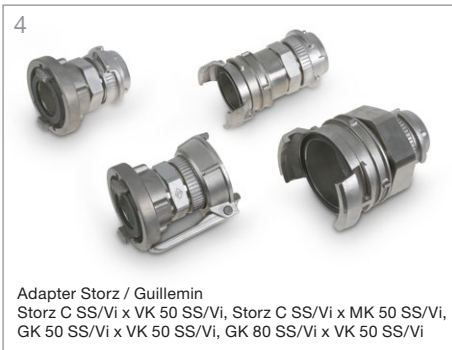
4 Adapter Storz / Guillemin Storz C SS/Vi x VK 50 SS/Vi, Storz C SS/Vi x MK 50 SS/Vi, GK 50 SS/Vi x VK 50 SS/Vi, GK 80 SS/Vi x VK 50 SS/Vi