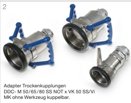
2 Adapter Trockenkupplungen DDC- M 50/65/80 SS NOT x VK 50 SS/Vi MK ohne Werkzeug kuppelbar.