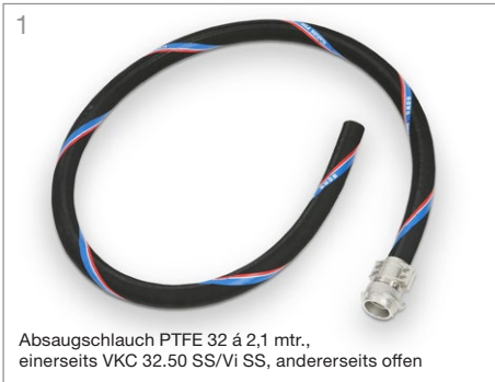
1 Absaugschlauch PTFE 32 á 2,1 mtr., einerseits VKC 32.50 SS/Vi SS, andererseits offen

Hinweis: Bei allen Bestellungen bitte "Für GW-G" erwähnen. Auf diese Weise wird sichergestellt, dass Schraubverbindungen an Übergangskupplungen ab Werk gegen ungewolltes Lösen gesichert sind und alle Gewinde- und Kupplungsdichtungen aus dem für GW-G präferierten Material FKM (FPM) geliefert werden.