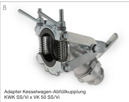
8 Adapter Kesselwagen-Abfüllkupplung KWK SS/Vi x VK 50 SS/Vi